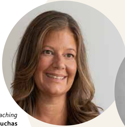
Beratung und Familiencoaching Nicola Puchas www.puchas-coaching.at